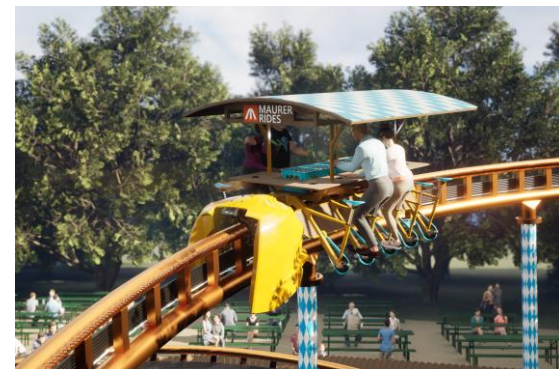
© Maurer Rides – Biergarten Achterbahn