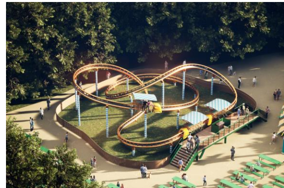
© Maurer Rides – Biergarten Achterbahn