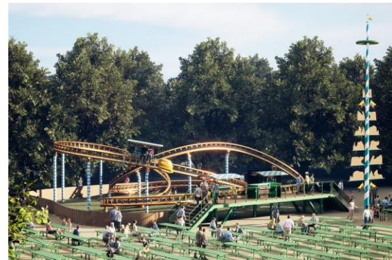
© Maurer Rides – Biergarten Achterbahn