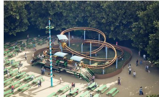
Biergarten Achterbahn